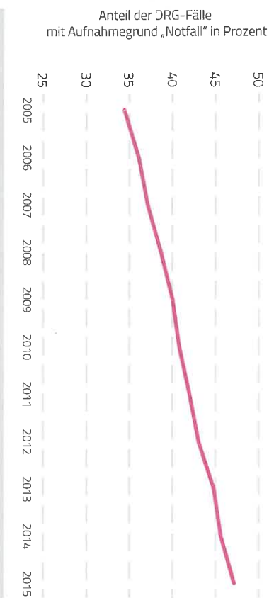
Abbildung 1: Anteil der DRG-Fälle mit Aufnahmegrund „Notfall“ an allen DRG-Fällen pro Jahr